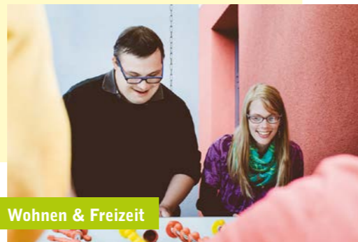
Wohnen & Freizeit