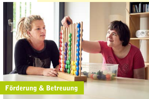
Förderung & Betreuung