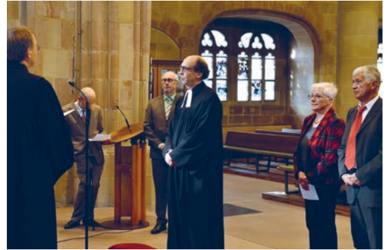
Die Investitur wird von den Zeugen begleitet