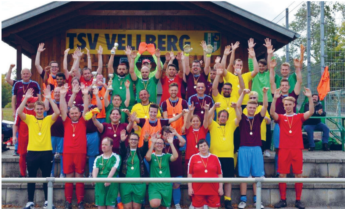
„Gemeinsam wir“ lautete das Motto und bunt wie die Mannschaften waren auch die Trikots der Spieler des ersten Vellberger Inklusionsturniers.