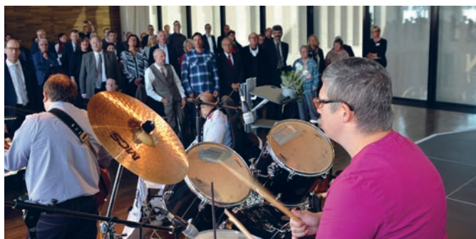
Andächtig lauschen die Gäste den Klängen von Better Than.