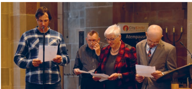
Gute Wünsche des Werkstatttrats und Bewohnerbeirats für den neuen Vorstand