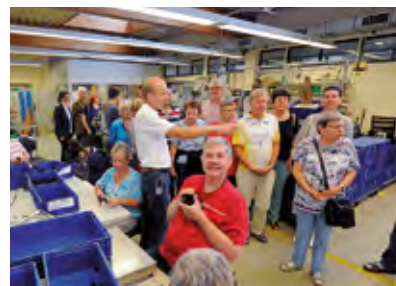
Die Lesersommer-Besucherguppe beim Rundgang durch die Abteilungen der Werkstatt.

Vor dem Rundgang erfuhren die Besucher einiges über die Bandbreite der LebensWerkstattangebote, über den Berufsbildungsbereich und über die Jobcoaches, die bei inklusiven Arbeitsplätzen die Mitarbeitenden und die Partnerfirmen begleiten und beraten.