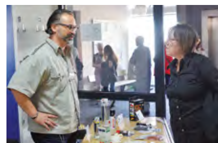
Reger Austausch am Tag der offenen Tür in Bad Friedrichshall

Alle Arbeitsbereiche, der BBB und der Förder- und Betreuungsbereich stellten sich vor. Hier wurde stolz der