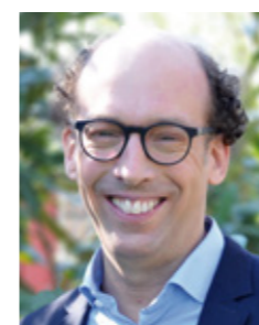
Herzlich grüßt Sie Ihr

Ich freue mich auf das gemeinsame Arbeiten an diesen Vorstellungen des BTHG und gehe daher zuversichtlich ins Neue Jahr 2020. Ich wünsche Ihnen einen guten Übergang ins Neue Jahr und alles Gute und Gottes Segen für 2020!