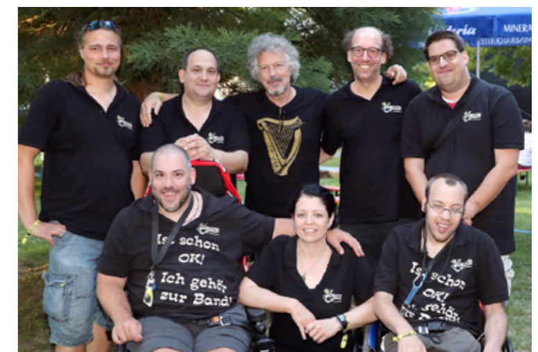
Better Than trifft Wolfgang Niedecken (Bild oben Mitte).

Lange war es schon geplant und angemeldet: Das Treffen mit Wolfgang Niedecken, Frontmann der Kölschrockband BAP, eine der erfolgreichsten deutschen Rockbands, die seit den 70ern mit zahlreichen, meist gesellschaftskritischen Hits, die Charts stürmt. Heiß war es und Massen von Menschen waren unterwegs, die das Programm des Blacksheep-Festivals erleben wollten. Umso schöner war es, dass sich Wolfgang Niedecken so viel Zeit für seine Musikerkollegin und -kollegen von Better Than genommen hat. Ein toller und herzlicher Austausch mit vielen neuen Ideen. Wir dürfen gespannt sein!