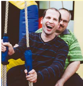
Bereich Förderung & Betreuung