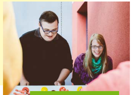
Wohnen & Freizeit